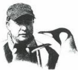
张波：中国科学探险协会副主席 《DEEP中国科学探险》杂志出版人